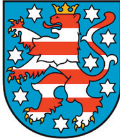
Le blason de l'État libre de Thuringe

Avant le 20 e siècle, la région autour de Wartburg et Weimar ne formait pas un État unifié sur le plan culturel et traditionnel mais se composait d'une mosaïque de petits États allemands. Cette situation territoriale morcelée a amené l'historiographie du 19 ème siècle à considérer les impulsions culturelles en Thuringe comme l'élément qui a généré la for-